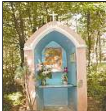
Situé en pleine forêt, le petit oratoire d'Ifiss est très régulièrement fleuri et entretenu.