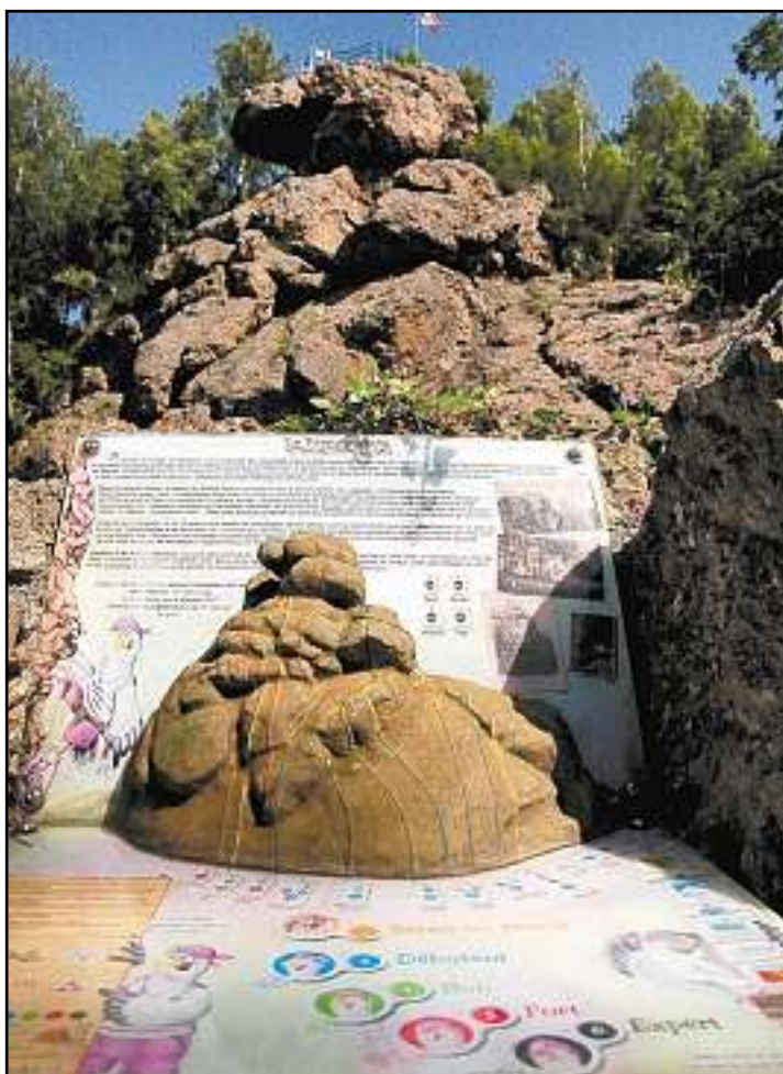
Les différentes voies d'escalade sont matérialisées sur cette maquette située au pied du rocher.

Pour accéder au rocher, le plus simple est de se rendre jusqu'à la Place du Silberthal, au bout du village de Steinbach. Ensuite, il convient de suivre le balisage spécial (une plume grise) qui conduit, en une quinzaine de minutes de marche, jusqu'au sommet du Hirnelestein. De là, un sentier descend, à droite, jusqu'au pied du rocher.