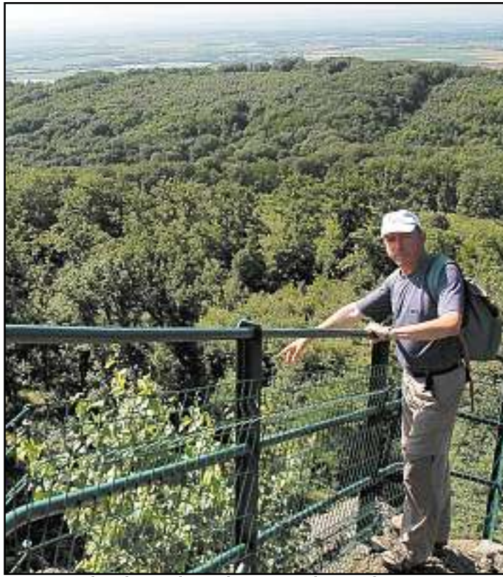
Par temps clair, la vue depuis le sommet du Hirnelestein peut porter jusqu'aux Alpes bernoises.

L'itinéraire entre maintenant dans la forêt. Le chemin monte et, arrivés à une fourche, nous prenons la branche de gauche (anneau jaune). Nous croisons un sentier qui arrive de Thann (triangle rouge) que nous ignorons pour rester, à droite, sur notre anneau. Nous débouchons sur un large carrefour de chemins. Nous poursuivons tout droit pendant quelques mètres pour admirer le petit oratoire d'Ifiss très joliment décoré.