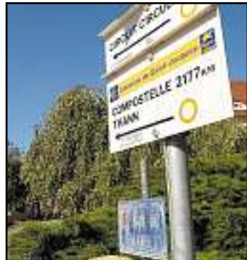
Saint-Jacques de Compostelle : un but lointain qui s'annonce au départ de cette randonnée, à proximité de la chapelle Birling.

Durée : environ 2 heures Distance : 6,4 km Dénivelé : 187 m Altitude de départ : 327 m (chapelle Birling) Altitude maximum : 510 m (Hirnelestein) Balisage : Anneau jaune (du départ à l'oratoire d'Ifiss), puis Croix bleue (du Supplaplatz au Hirnelestein). Ensuite, l'itinéraire n'est pas balisé.