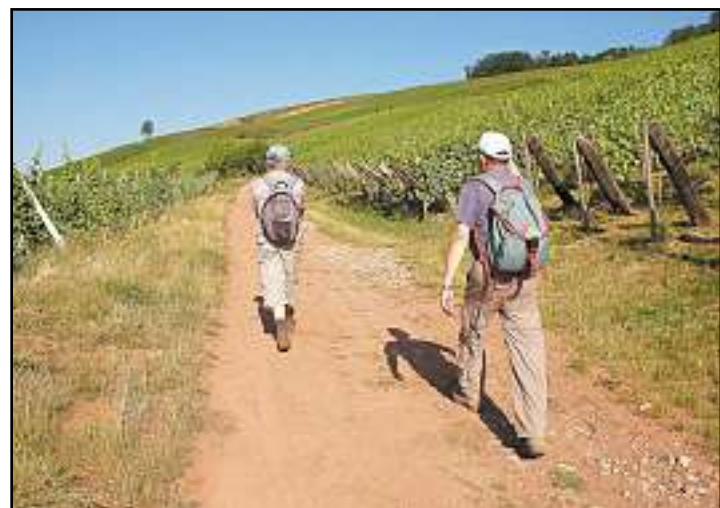
À travers le vignoble, l'itinéraire suit la Cote 425, où de très violents combats eurent lieu en janvier 1915.